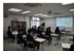
総合的な学習の時間 (オンライン職場見学)