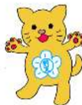
児童生徒会マスコットキャラクター ふしにゃん