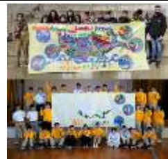
社会生活・総合・美術 (国際協働学習)