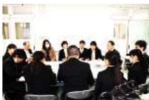
公開研究協議会（公開授業）