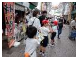
生活 <弘明寺商店街>

※体育、図画工作、音楽、国語・算数(午後)は課題別でグループごとに学習しています